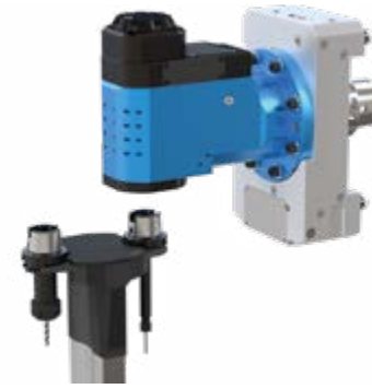
Winkelköpfe zum automatischen Ein- und Auswechseln der Front-Werkzeuge

In der Fertigung sind oftmals verschiedene Werkzeuge im Einsatz. Mit Winkelköpfen zum automatischen Ein- und Auswechseln der Front-Werkzeuge lassen sich unterschiedliche Prozessvarianten wirtschaftlich abbilden.