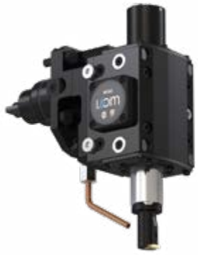
Stoßeinheit BENZ LinA 4.0