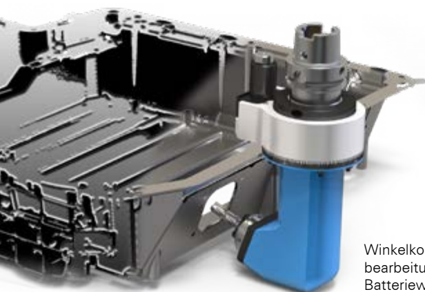
Winkelkopf für Fräsbearbeitung an einer Batteriewanne für Elektrofahrzeuge