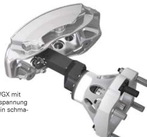
Winkelkopf Slim WGX mit direkter Werkzeugspannung für Bearbeitungen in schmaler Störkontur