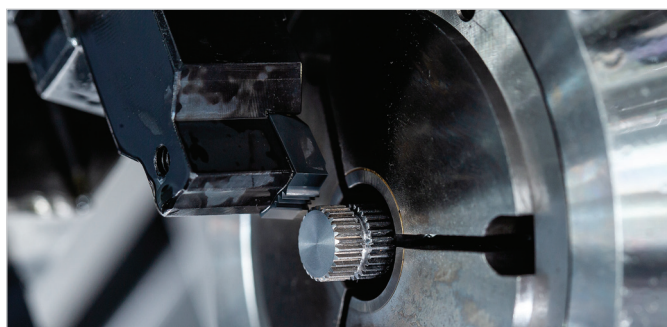
Obrábění ozubení pomocí systému S117.

Nabídka produktů společnosti Horn zahrnuje řadu nástrojů pro výrobu různých geometrií ozubení s modulem 0,5 až 30. Ať už jde o ozubení na čelních kolech, spojení hřídel-náboj, šnekové hřídele, kuželová ozubená kola, pas-torky, nebo na specifické profily dle zákazníka, všechny tyto profily zubů lze hospodárně vy-robit pomocí nástrojů pro frézování nebo obrábění.