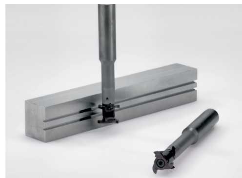
Frézy pro frézování drážek