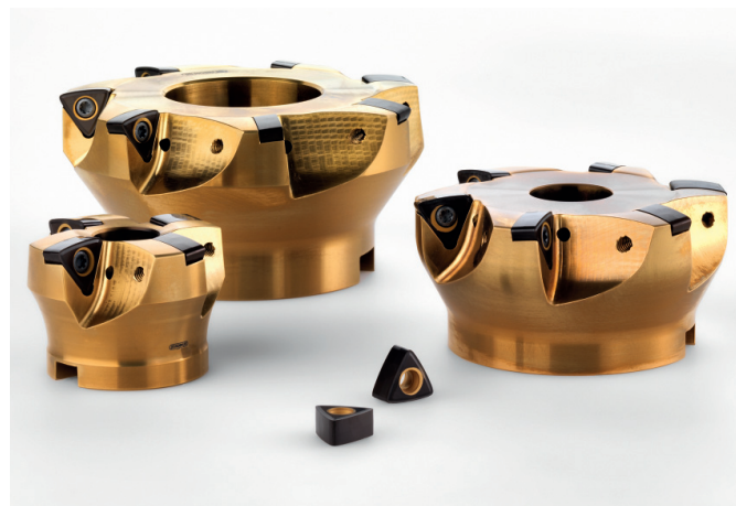
Vysokosopuvové frézy firmy Horn, kterou na českém a slovenském trhu zastupuje společnost SK Technik.

znamenány velké odchylky nahoru ani dolů.“